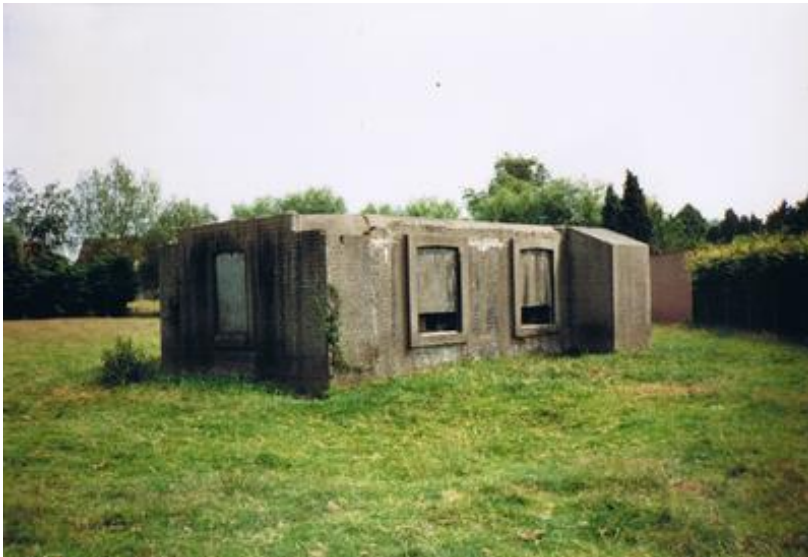
Bunker As5 anno 1995.

Jullie mogen mij gerust contacteren mochten jullie nog verdere info wensen over dit project rond Bruggenhoofd Gent of andere lopende projecten in de regio.